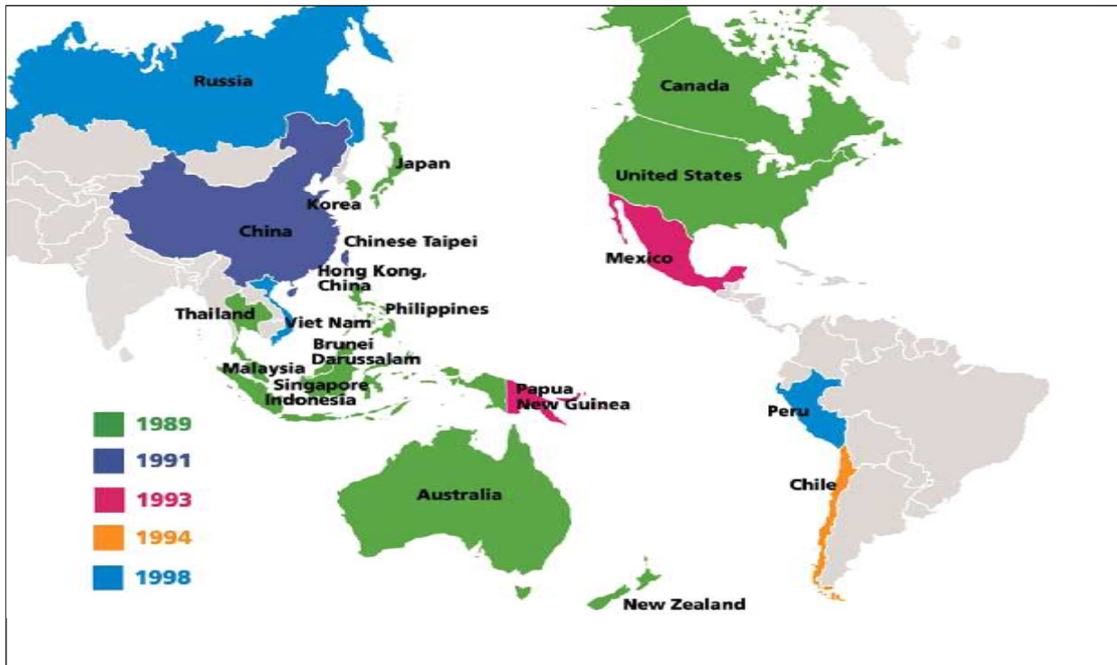
Figura No.2 Economías de APEC